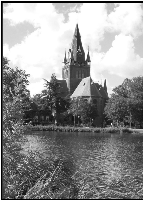
Sint Urbanus, Nes aan de Amstel