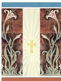
St. Urbanuskerk Nes van de Aa

Het is geen gemakkelijke boodschap, dat is wel duidelijk inmiddels. Het wordt absoluut anders, dat is eveneens helder. Momenteel zijn we ons aan het voorbereiden om, samen met het centraal kerkbestuur van de regio, ons plan voor te gaan leggen bij het bisdom. We weten van de “spelregels” van het bisdom welke gelden voor een nieuwe toekomst, toch zien we de meerwaarde voor beide partijen in onze oplossingen: Een plek van samenkomen voor de Nesser-gemeenschap en omgeving, beheerd door een onafhankelijke, capabele stichting waarbij er verschillende activiteiten kunnen plaatsvinden met respect voor de historie van onze St.Urbanus en waarmee het complex in stand en toegankelijk gehouden kan worden. Het kán echt! We houden u op de hoogte van de ontwikkelingen, wellicht binnenkort via een info-sessie in de kerk..