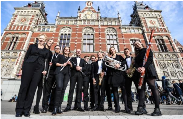
(foto: leden van het orkest voor het centraal station in Amsterdam)

Uniek: de Amsterdamse Tramharmonie ( www.tramharmonie.nl ) komt een fantastisch kerstconcert ten gehore brengen en natuurlijk mag u ook meezingen! Dit blaasorkest is in 1906 ontstaan als bedrijfsfanfare van Gemeentetram Amsterdam en uitgegroeid tot een eigentijdse muziekvereniging. Deze hechte club van ruim 50 leden heeft al meer dan 50 keer in het Concertgebouw gespeeld en daarnaast in vele andere Amsterdamse zalen. Komt dat zien en horen!