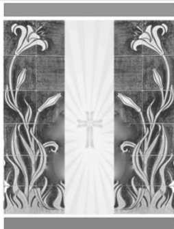
St. Urbanuskerk Nes aan de Amstel